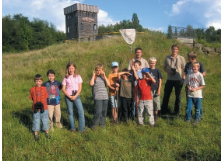
Natur hautnah erleben: Die Kindergruppe des NABU Bochum auf Insektensafari.