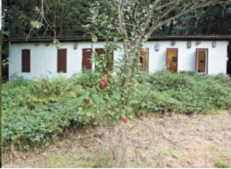
Das NABU-Haus im Höntroper Südpark.

Eine Mitgliedschaft hat natürlich auch für Sie Vorteile: Das Magazin Naturschutz heute, freien Eintritt zu allen NABU-Zentren bundesweit und kostengünstige Freizeitangebote für Kinder und Jugendliche und vieles mehr.